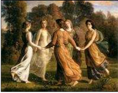
Rayons du soleil (Louis Janmot)

(1814-1892) in een met de pre-rafaeliten verwante stijl. Zie links het schilderij 'Rayons du soleil', onderdeel van de grote cyclus 'Le Poème de l'ame', een mystieke uitbeelding van de gang van de ziel door het leven. De puurheid, sereniteit, en de kwetsbare schoonheid van deze schilderijen ontroerde me echt, omdat het soms verloren kwaliteiten lijken in onze harde, banale en vaak ruwe maatschappij.