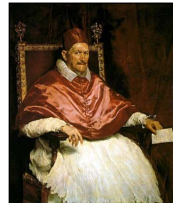
Paus Innocentius X (Diego Velasquez, 1650)

In Palazzo Doria Pamphili stond ik oog in oog met het indrukwekkendste portret uit de 17e eeuw, dat van Paus Innocentius X, gemaakt door de Spaanse kunstenaar Diego Velasquez. De niet zo vrome kerkvader werd vastgelegd met een bijzonder ongemakkelijke uitdrukking op het gelaat... Als ik zoiets zie, wordt mijn bewondering voor scheppende kunstenaars alleen nog maar ontzaglijker. Grote schrijvers, oké, geniale wetenschappers, indrukwekkend, maar schilders, beeldhouwers en componisten, dat zijn voor mij een soort heiligen, in die zin dat zij in staat zijn mensen van alle tijden door hun kunst met elkaar in verbinding te brengen en te ontroeren.