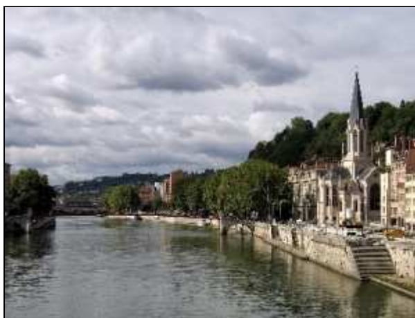
De rivier de Saône in Lyon