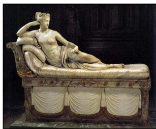
Paolina Borghese (Antonio Canova, 1804-1808)

Ontroering maakte zich meester van mij tijdens een bezoek aan Villa Borghese, dat geheel gerestaureerd is, en een ongelooflijk rijke kunstverzameling bezit, waaronder beroemde werken van Caravaggio, Cranach, Rafael, Bernini. Erg mooi vond ik bijvoorbeeld het beroemde beeldhouwwerk dat Antonio Canova maakte van Paolina Bonaparte Borghese, de zuster van Napoleon.