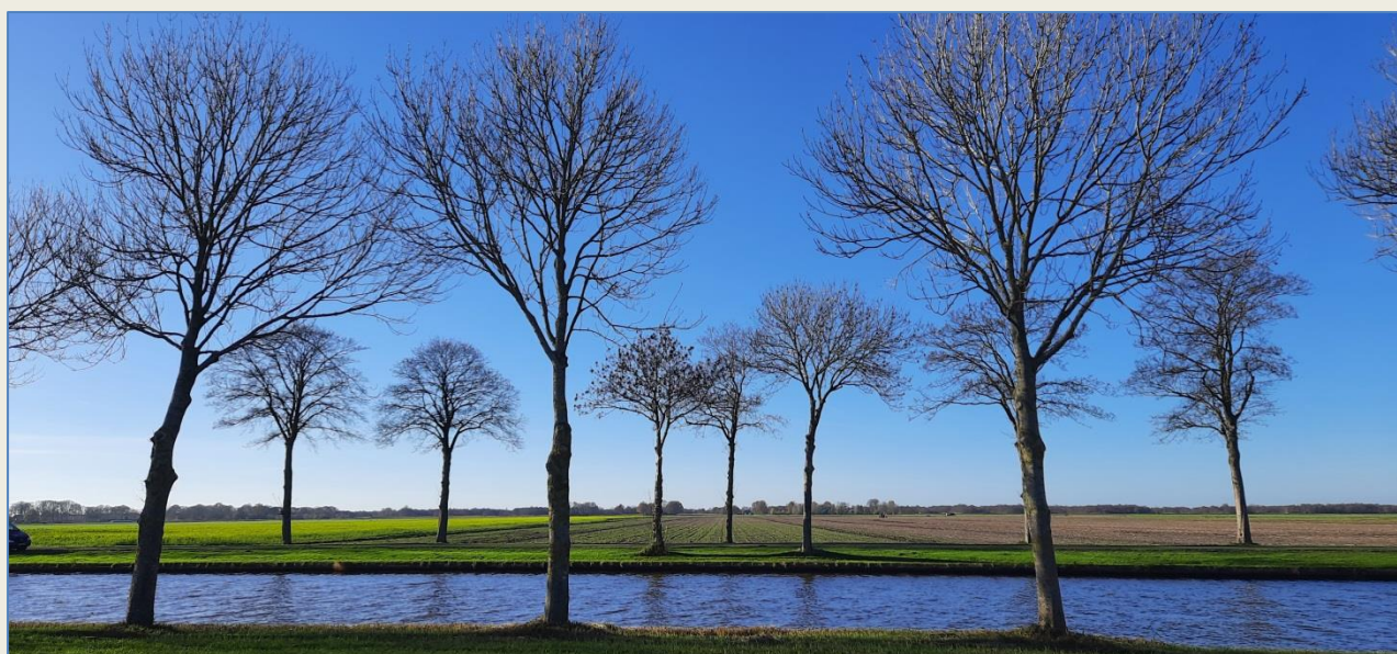
Kanaaldijk in Giethoorn

Foto gemaakt tijdens een midweekje Drenthe in november